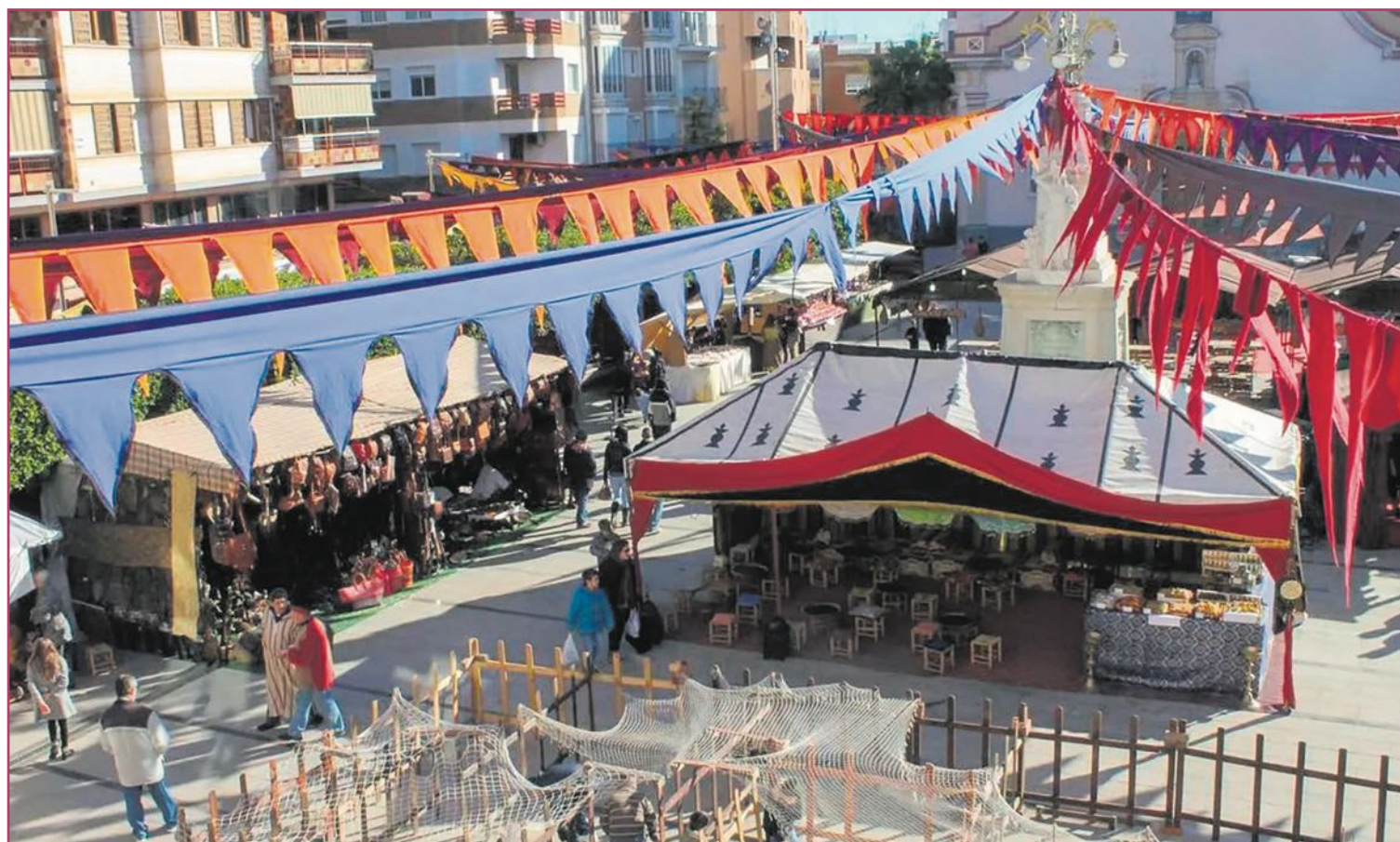
Mercado en la Feria Medieval de San Sebastián de Alfafar.

Así pues, alfafarenses y visitantes pueden disfrutar de pasacalles; espectáculos de música y danza tradicional; actuaciones teatrales, y varias recreaciones históricas como, por