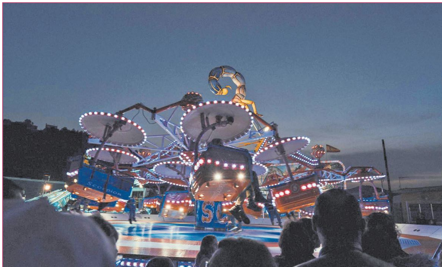
Feria en el porrat de Potries.

Lo que está claro es que estos mercados surgieron en