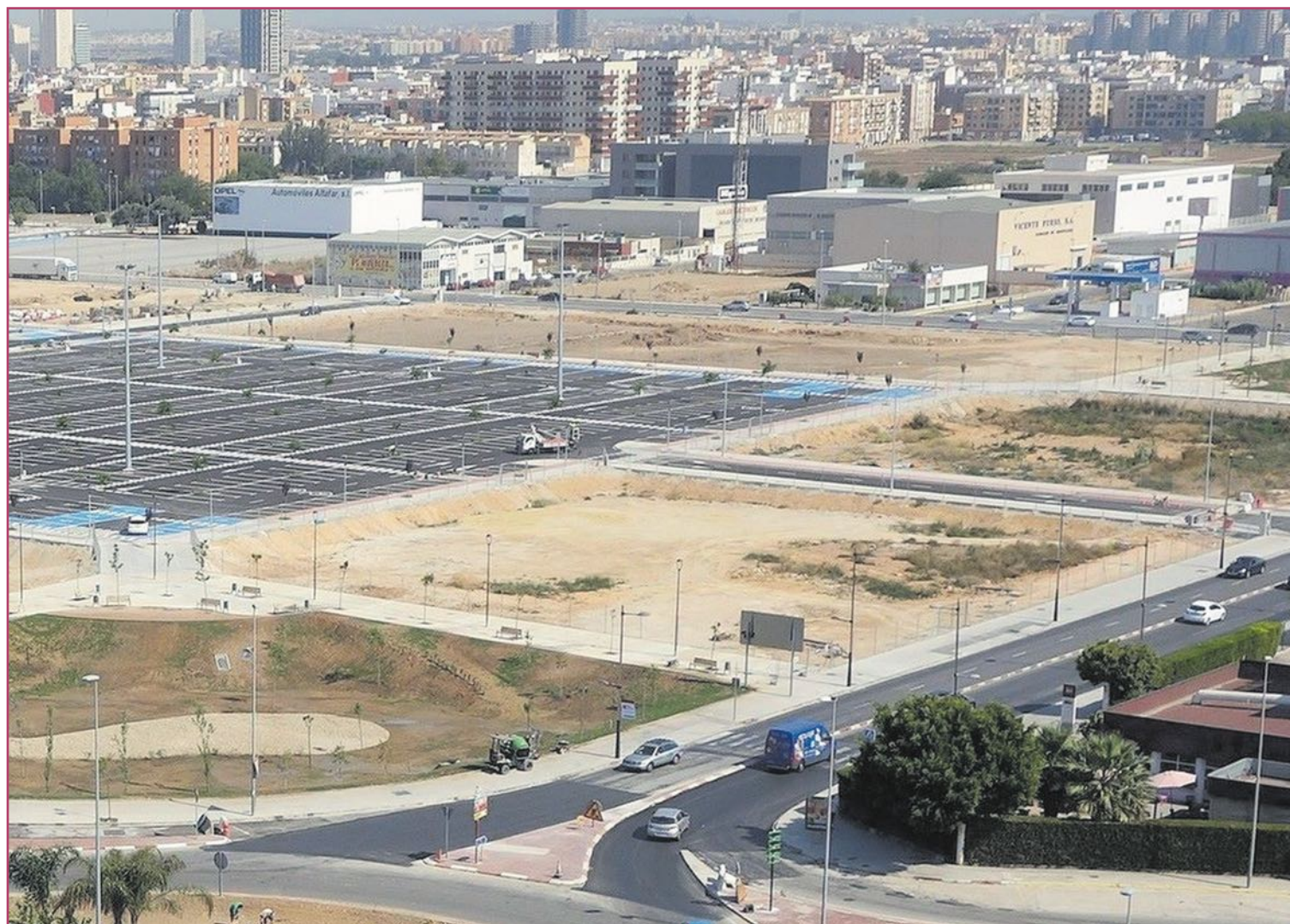
Los polígonos comerciales, además de dinamizar la economía, se han convertido en un atractivo extra a la hora de visitar el municipio

Hay pasado donde hurgar, eso sí. Aunque todo indica que