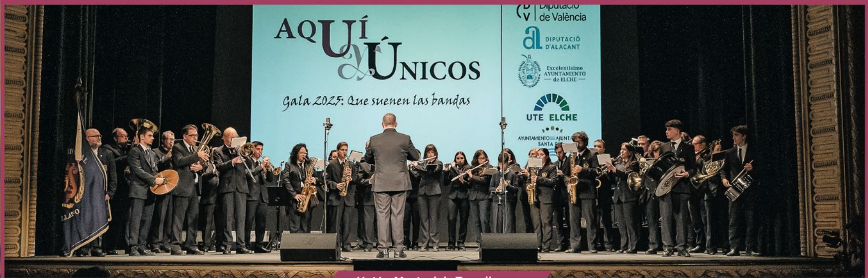
Unión Musical de Torrellano