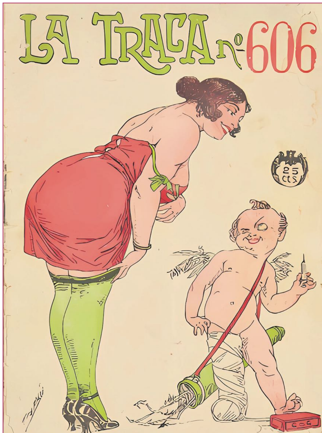
'La Traca' es aún, sin duda, el más famoso ejemplo de las publicaciones satíricas lanzadas desde la Comunitat Valenciana.

Generalmente estaban comandadas por audaces periodistas-editores