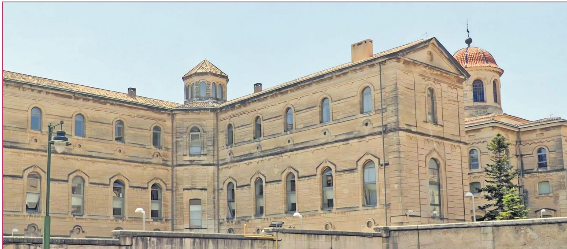
Un geriátrico que antaño fue uno de los más veteranos hospitales de la hoy Comunitat Valenciana, el alcoyano Civil de Oliver.

Queda desperdigada por nuestra Comunitat Valenciana una pequeña huella de hospitales que fueron y que, siglos después, todavía son