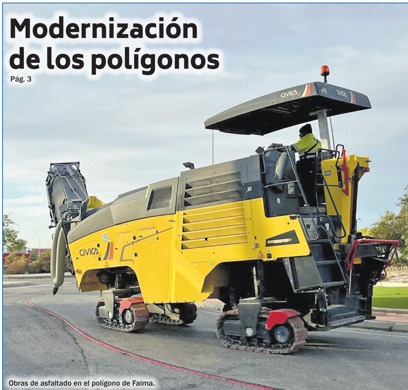
Obras de asfaltado en el polígono de Faima.