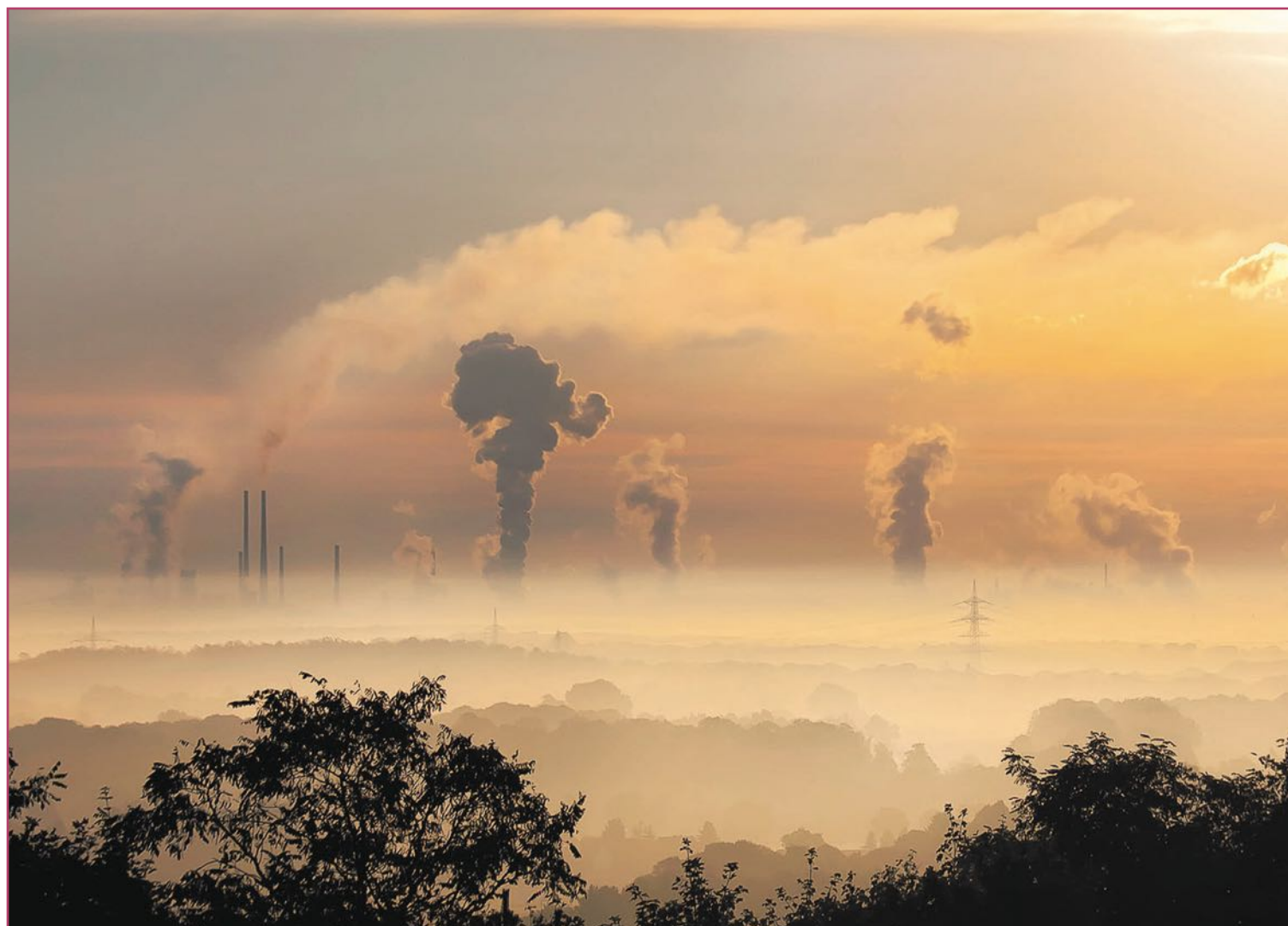
Cada año, proyectamos toneladas de dióxido de carbono a la atmósfera, necesitando controlar nuestras emisiones.

Tales de Mileto se planteó que todo estaría formado por un elemento