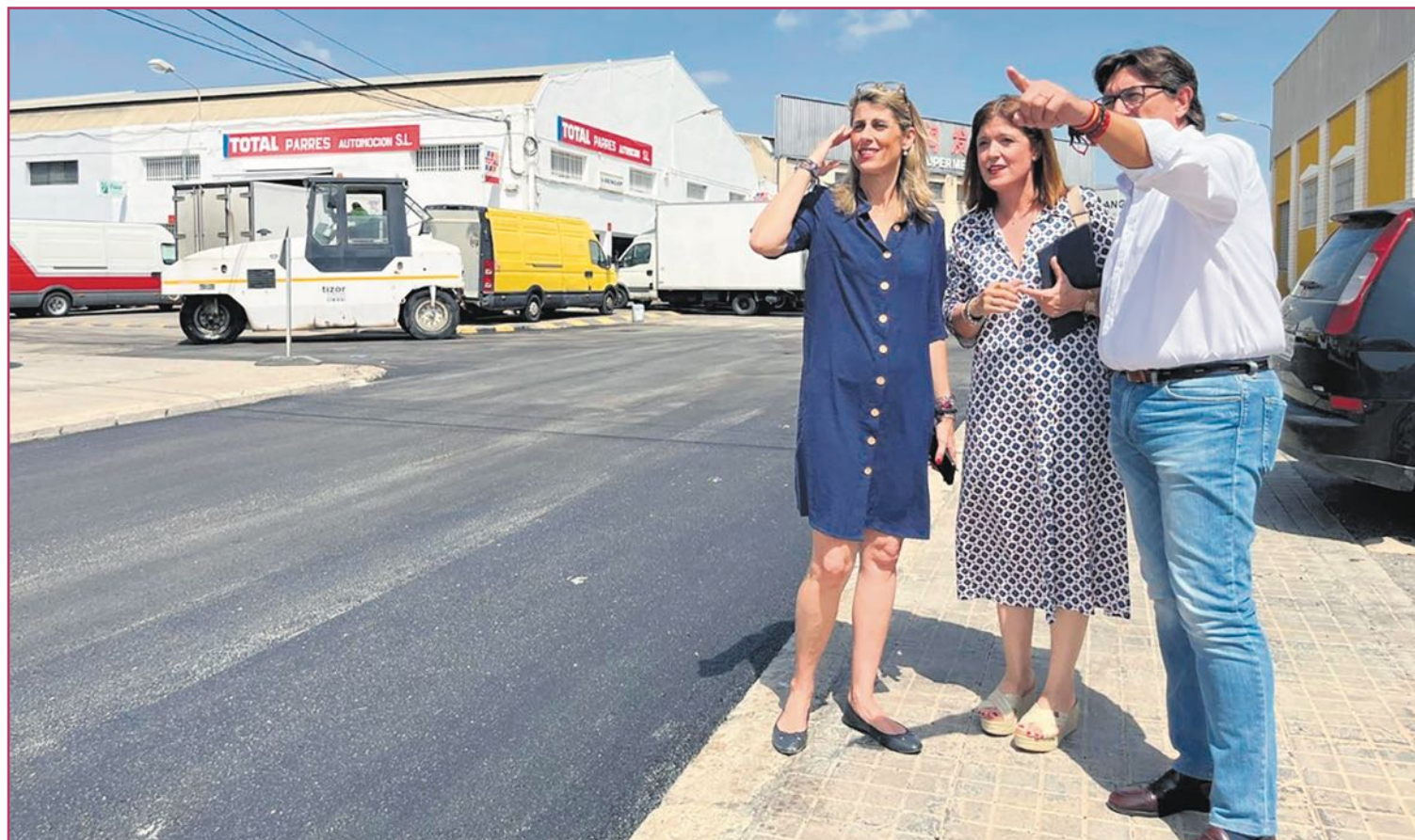
La alcaldesa junto a los concejales de Infraestructuras y Planteamiento Urbanístico, en el Boch.

Cabe recordar que a principios de 2024 el Ayuntamiento logró recepcionar oficialmente dicho polígono, poniendo fin así a su situación de limbo jurídico.