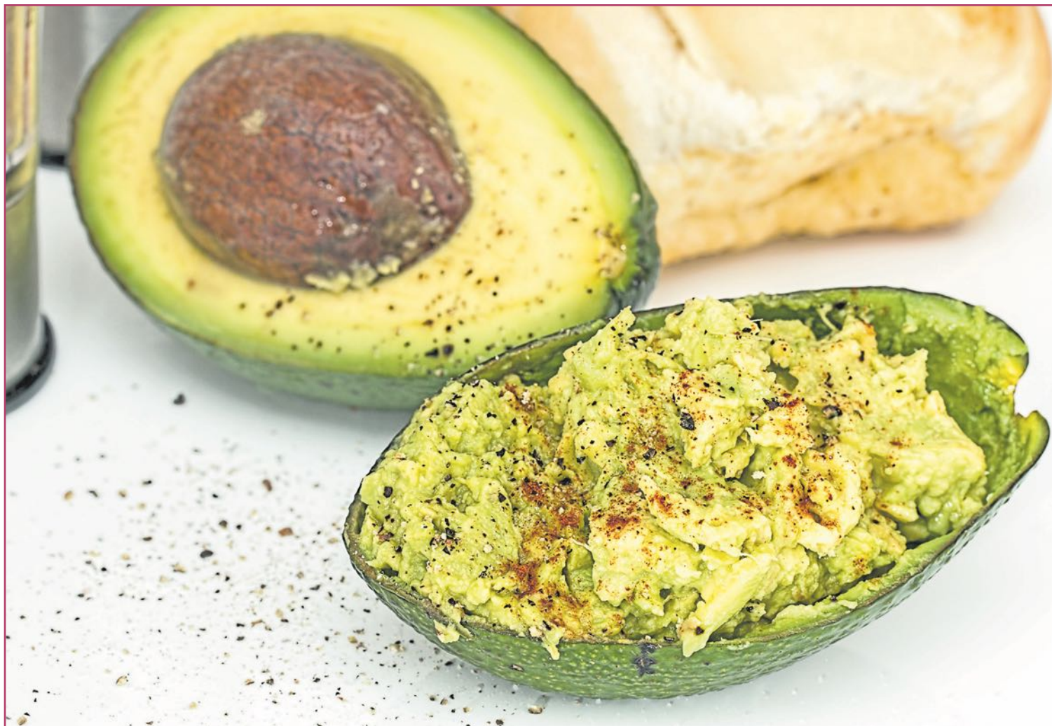
Aparte del recurrente y veterano guacamole, el aguacate se presta a multitud de preparaciones culinarias.

L'Horta Sud (en Alcàsser, Picassent, Silla...), La Safor (como en Gandia), las Riberas Alta (especialmente en Alzira) y Baixa: la crianza del aguacate se extendió por las huertas de la provincia valenciana. También por la Marina Baixa alicantina. Fue sobre todo desde Callosa d'en