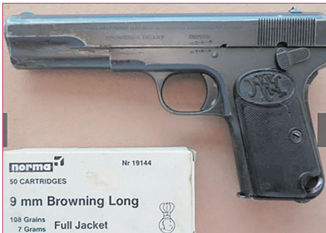
Modelo similar al señalado por los peritos (FN Browning 1903). Si se localiza el arma utilizada su análisis podría aportar las pistas necesarias para esclarecer quién disparó.

El crimen desató una tormenta mediática y destapó las tensiones internas de una de las familias más acaudaladas de la provincia. El testamento del patriarca establecía un reparto