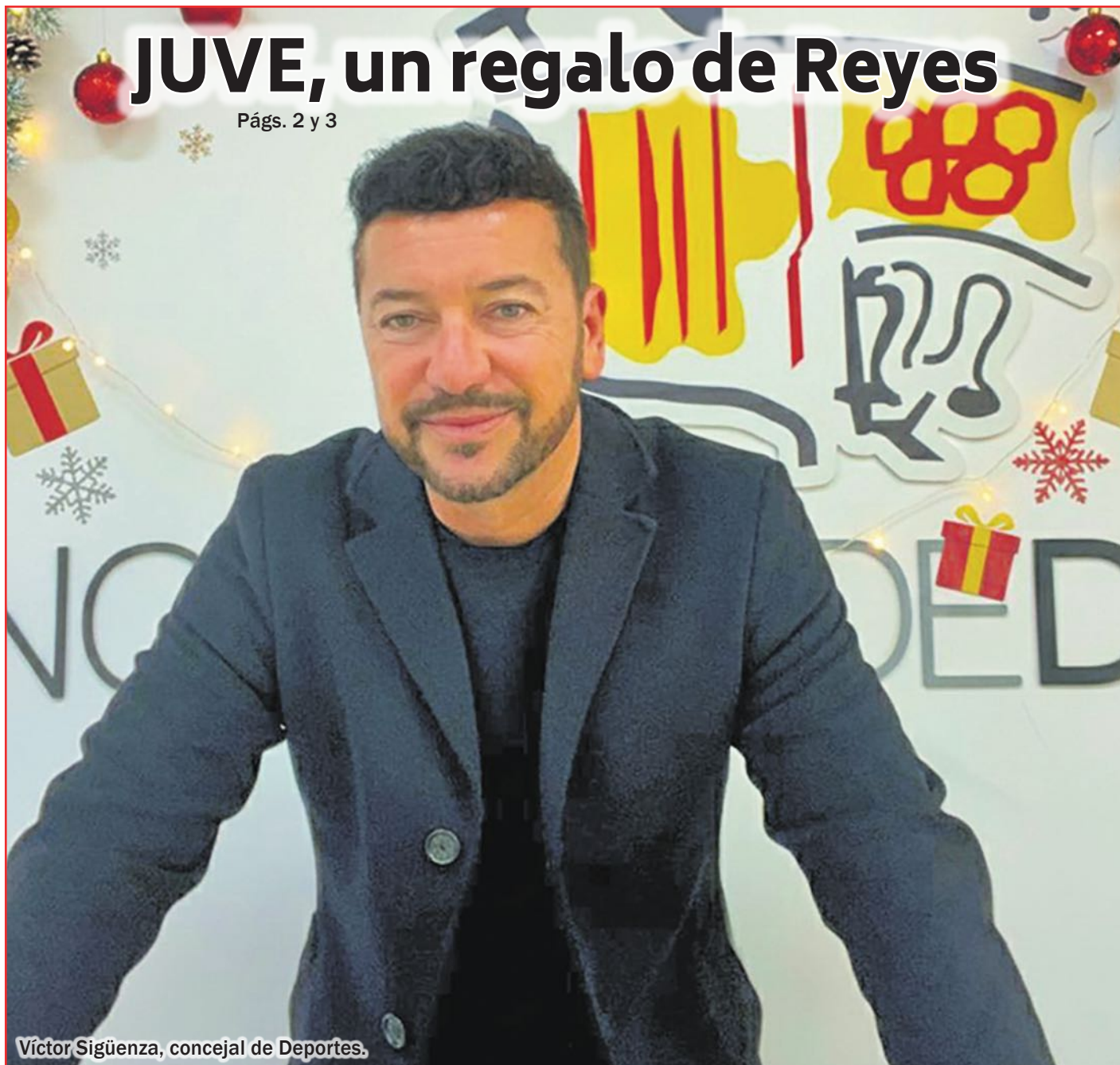
Víctor Sigüenza, concejal de Deportes.