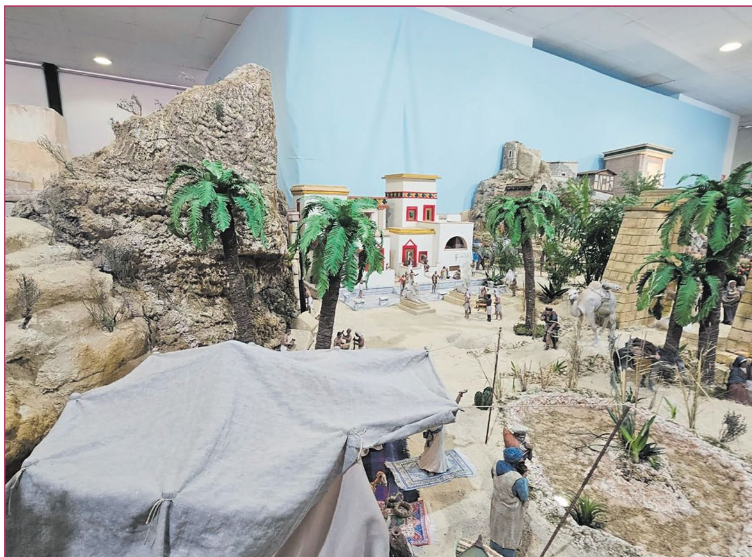
Belén municipal ubicado en la plaza Ramón Sijé.

Habrà Nochevieja infantil al mediodía tanto en el casco urbano como en la Costa