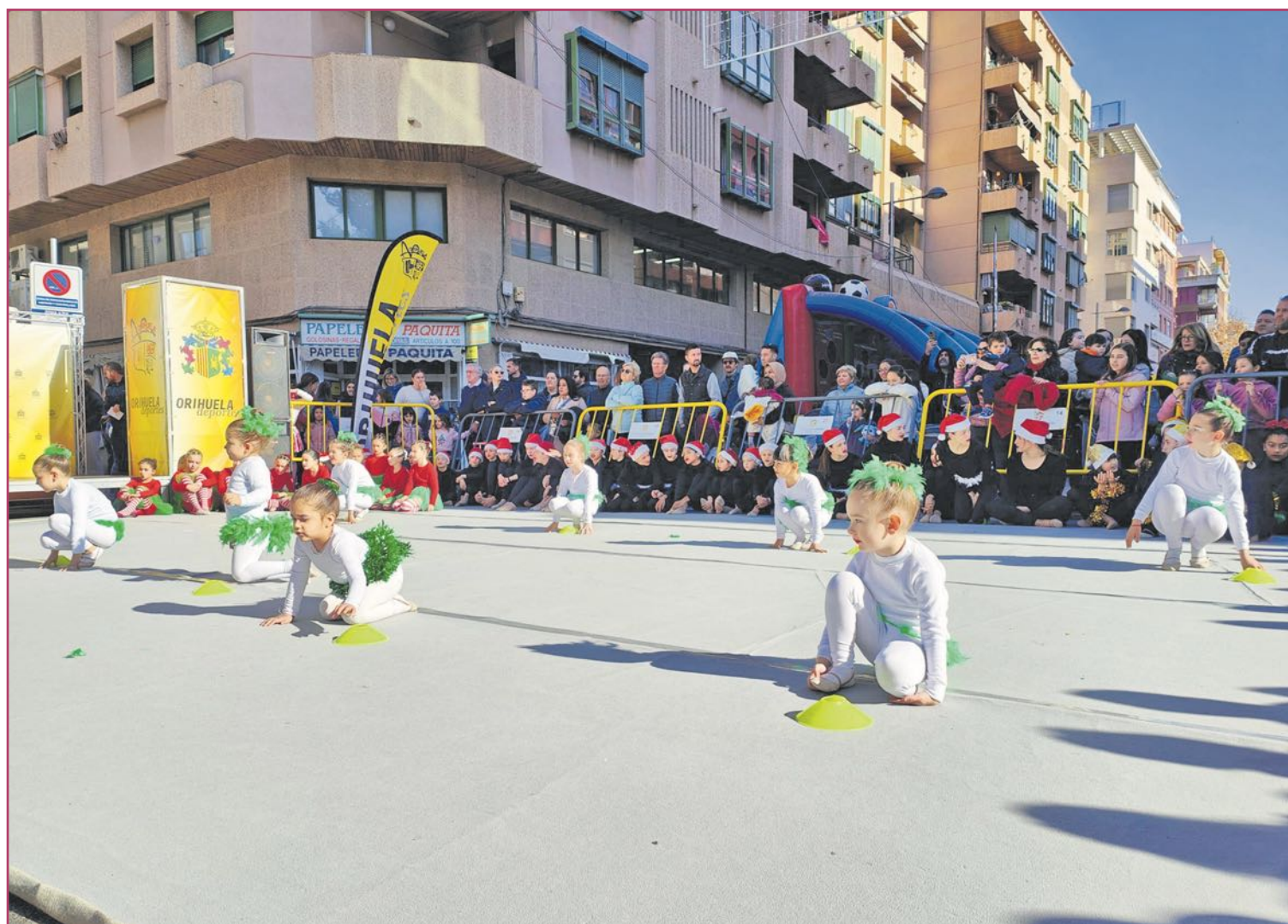
Actuación de danza en la JUVE 2025.

De igual manera aquí encontraremos hinchables, una pista americana de 64 metros, una pista de obstáculos, un rocódromo, una tirolina, una red de maniobras navales, camas