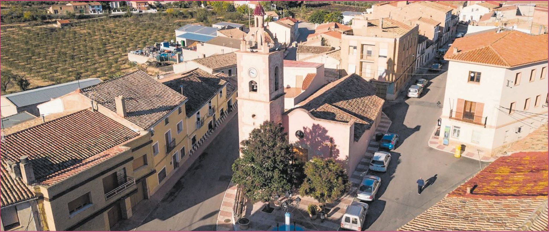
Imagen de Las Cuevas con la parroquia dedicada a la Virgen de Loreto en primer plano.

Desde su construcción en la Edad Media, la Parroquia de Nuestra Señora del Loreto de Utiel ha sido el eje de crecimiento de Las Cuevas