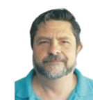
Fede Romero MAQUETACIÓN