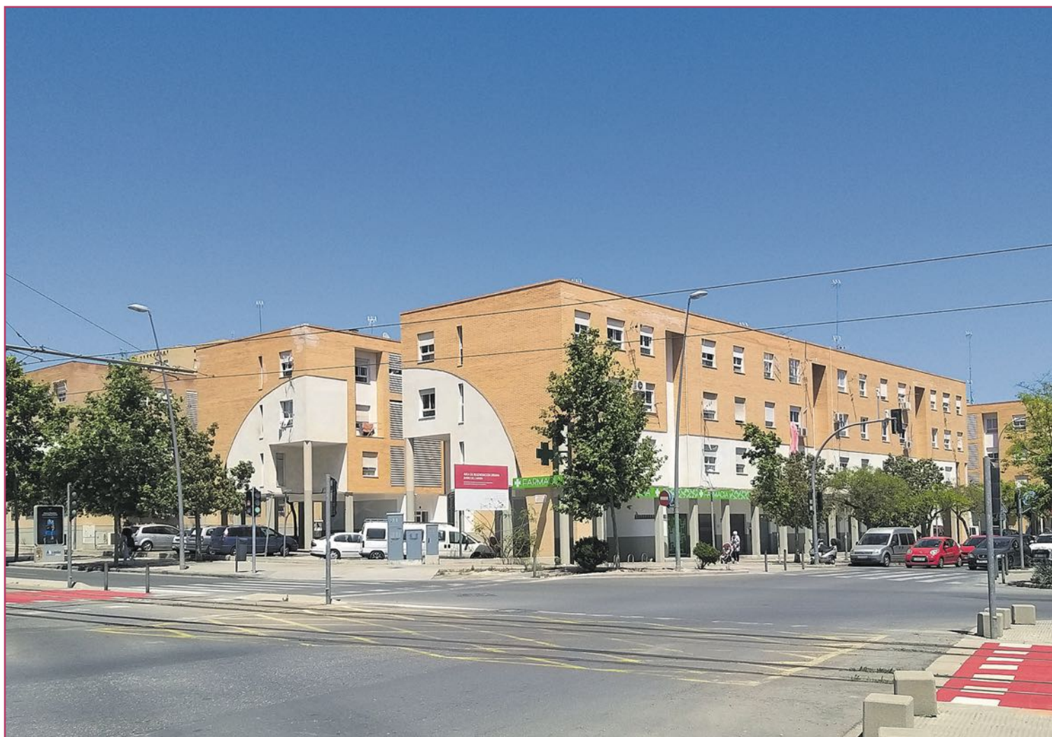
El actual barrio Virgen del Carmen, popularmente las Mil Viviendas, tuvo que ser rescatado de su profunda degradación

Iba a crecer Alicante capital, especialmente derribarse las murallas, sentenciadas tras la sesión municipal del 13 de julio