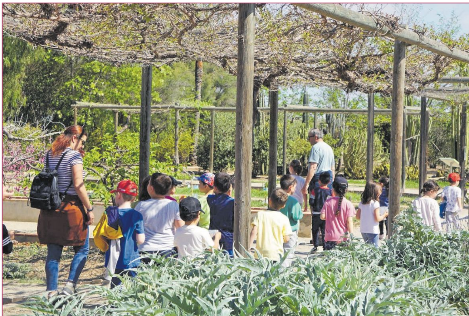
La interacción educativa entre alumnado, profesorado y profesionales medioambientales forma parte de los programas ecológicos y sostenibles de la Conselleria | Generalitat Valenciana

La Fundación Mediterráneo se hizo cargo, finalmente, del Centro Educativo de Medio Ambiente (CEMA) Los Molinos, en Crevillent, de 1979. Por contra, el CEMACAM de la Font Roja (de página web 'privada' y correo 'mudo'), en Alcoy (de actividad documentada desde la década del 2000), no parece ahora depender de nadie, aunque está dentro de un parque natural lógicamente gestionado por la Generalitat Valenciana.