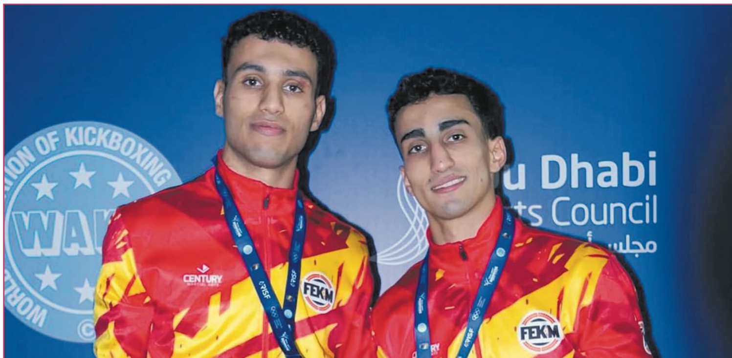
Los hermanos Talhaoui tras su paso por un Mundial.

Por ello, quiero agradecer a mis padres que nos 'obligaran' a seguir esforzándonos porque, en mi caso, también tuve esos momentos en los que, como mis amigos, quise probar otras cosas como el fútbol; pero mi madre siempre dijo que no y al final se ha demostrado que tenía razón.