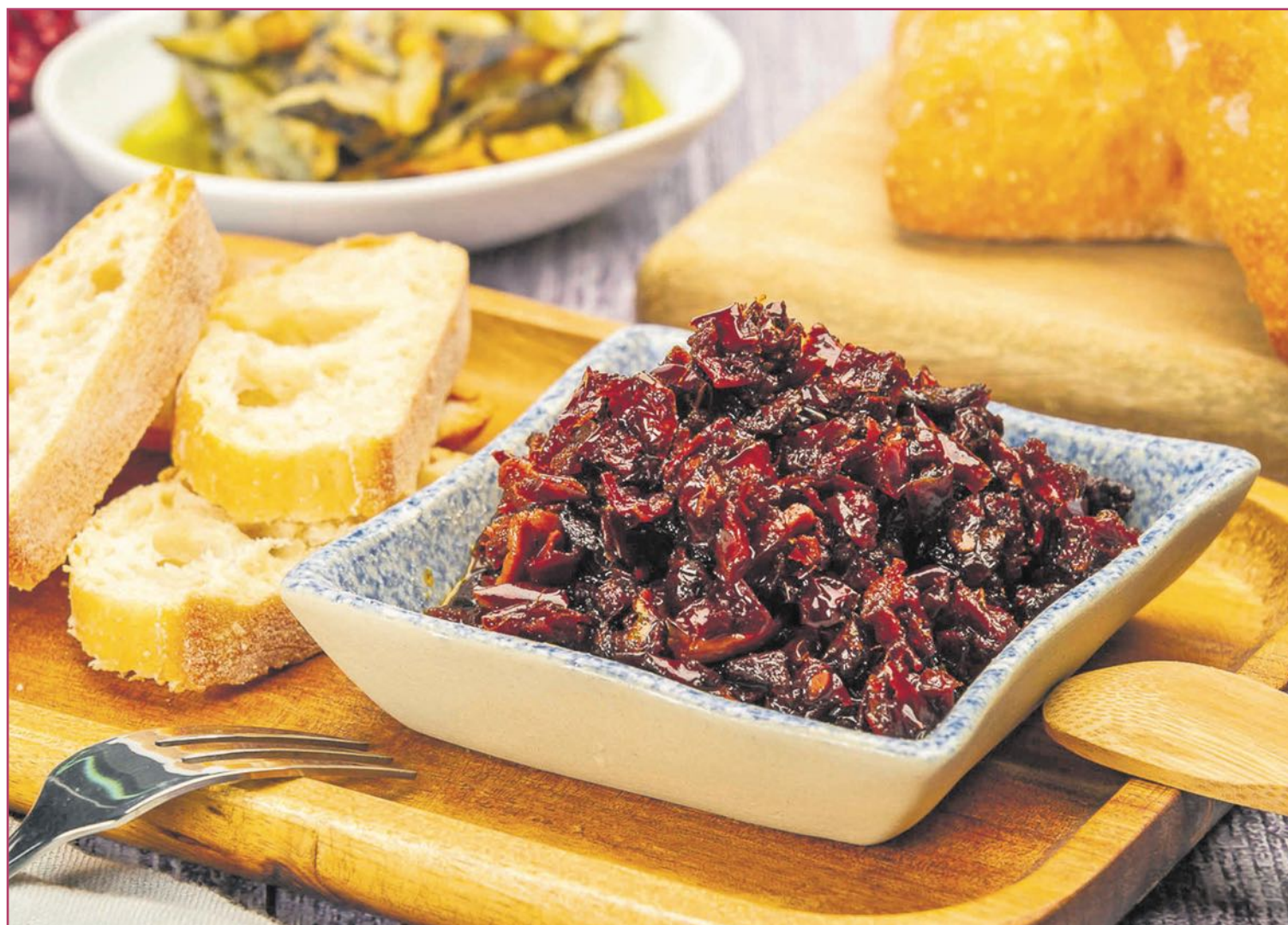
La 'pericana', una de nuestras tapas basada en el mar, aunque curiosamente se gestó en las montañas | Turisme Comunitat Valenciana

¿Se trataba de las mismas tapas para todo el país, o se colaron también especificidades