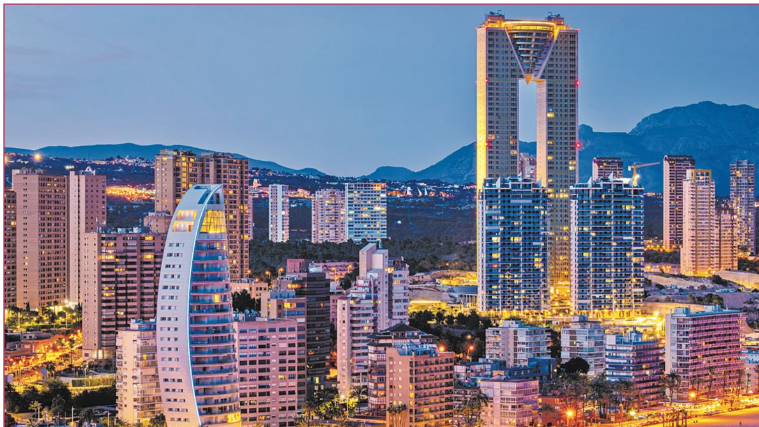
Benidorm es uno de los municipios con mayor deuda según Hacienda.

Pese a este repunte, los datos están todavía muy lejos de los niveles registrados en la anterior gran crisis económica. En 2012, los ayuntamientos alicantinos acumulaban más de 1.200 millones de euros de deuda, una cifra que