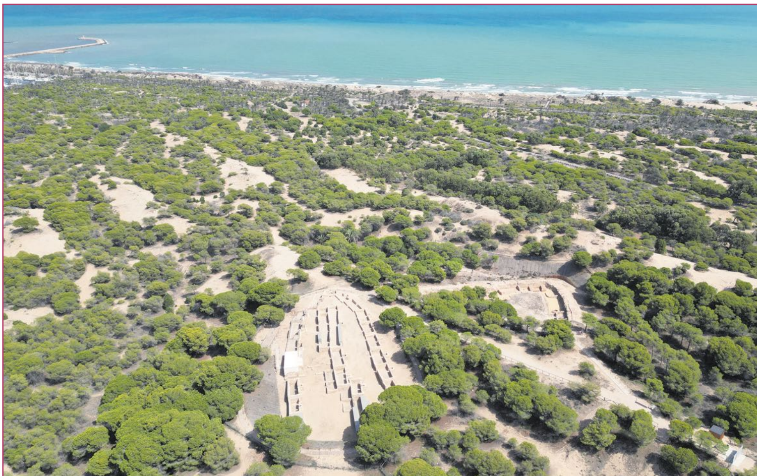
El yacimiento arqueológico de La Rábida Califal opta a ser declarado Patrimonio UNESCO.

Siempre se puede y se debe invertir más. No reconocer esto