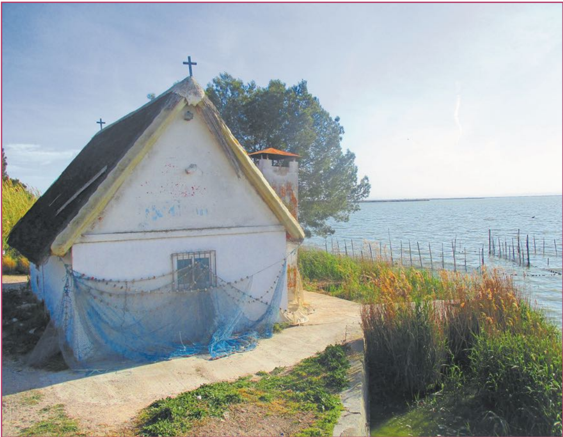
Barraca de la Albufera de Valencia.

fase de conclusiones. Lo lanzaremos pronto, aunque todavía no tenemos una fecha concreta. Me comprometo a daros otra entrevista cuando llegue ese momento porque va a ser algo muy destacado. En cualquier caso, para mi