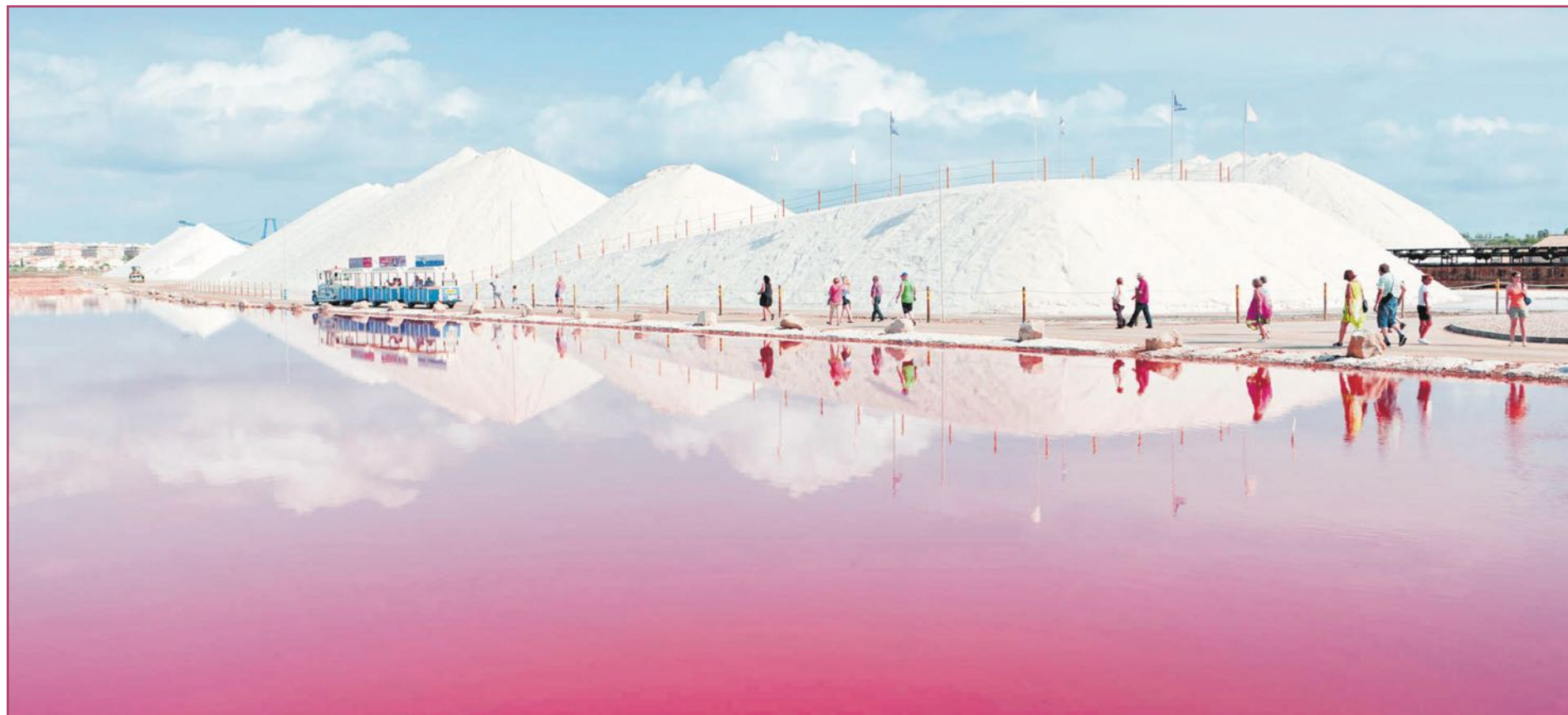
Torrevieja se ha convertido en un caso paradigmático de explotación salina a gran escala, y aún en activo prácticamente desde el Medioevo | Turisme Comunitat Valenciana

Desde las costas a las montañas, los yacimientos de cloruro sódico anotan aspas en nuestros mapas de la Comunitat Valenciana, algunas de ellas muy productivas