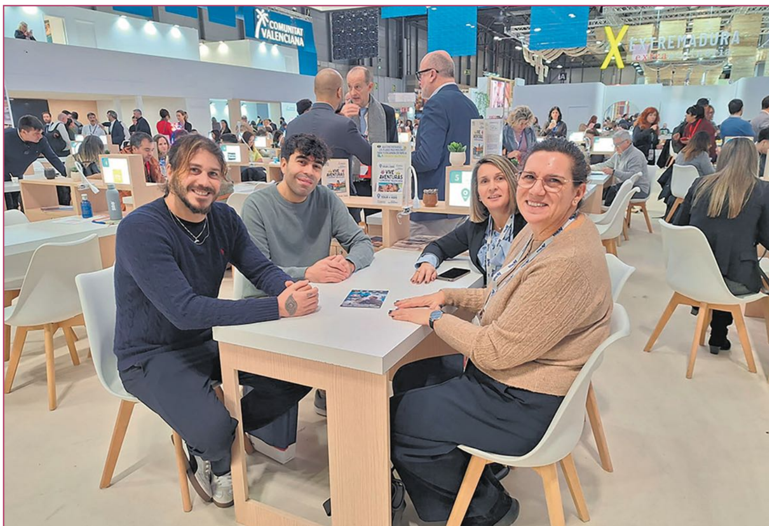
Imagen del equipo alteano desplazado a Fitur.

Uno de los pilares fundamentales de esta estrategia ha sido el Plan de Accesibilidad Turística, elaborado en el año 2020 en colaboración con el grupo empresarial social de la Fundación ONCE, Ilunion. Un documento que marca la hoja de ruta y que recoge un amplio abanico de acciones destinadas a mejorar tanto la accesibilidad física como la sensorial y cognitiva.