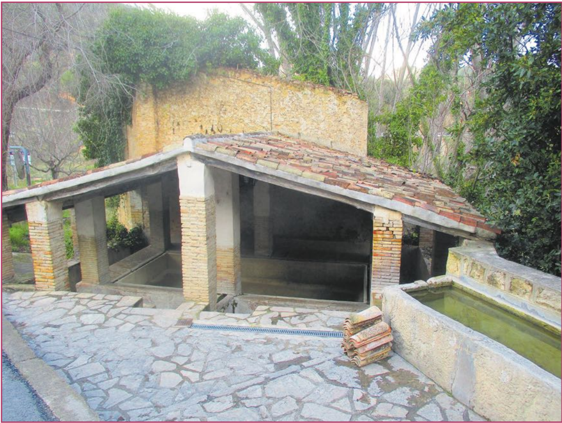
Lavadero medieval de Planes (Alicante).

Debemos descubrir todas las oportunidades que genera el interior. Actualmente estamos en plena redacción de un Plan Integral de Reto Demográfico para la Comunidad Valenciana, y va bastante avanzado estando ya en