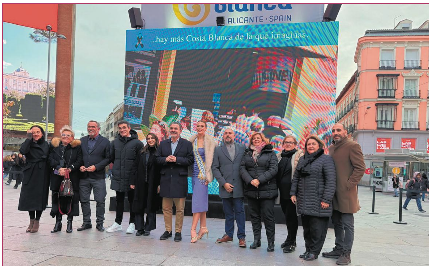
L'Alfàs del Pi también fue protagonista en Madrid fuera de las instalaciones de Ifema.

En 2028 el Cinema Roma celebrará sus cincuenta años, junto al 40º aniversario del festival