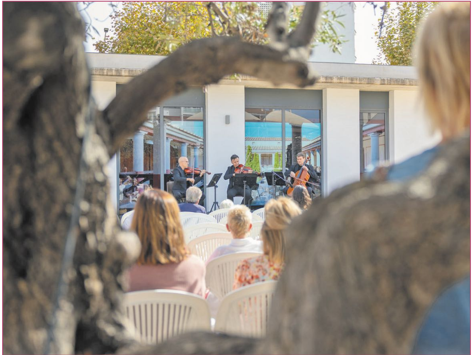
L'Alfàs organiza multitud de actos culturales a lo largo del año.

Con una programación diversa, creativa y abierta a todos los públicos, comienza a rodar 'L'Alfàs 2026. Año Cultural'. Un año que invita a residentes y visitantes a vivir las tradiciones, participar activamente en la vida cultural y reafirmar a l'Alfàs del Pi como uno de los grandes referentes culturales de la Marina Baixa.