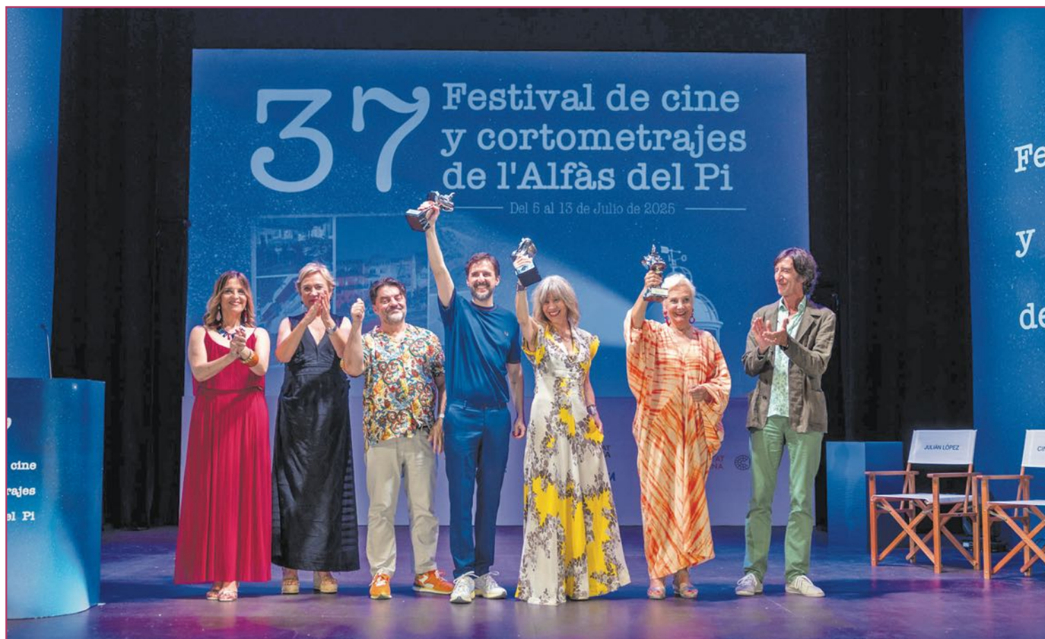
El Festival de Cine sigue siendo el principal escaparate cultural del municipio.

A ello se suma una red de catorce espacios culturales, "mu-